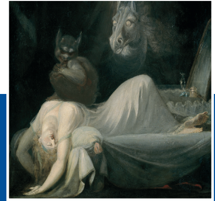
Johann Heinrich Füssli Der Traum

appr. Psychotherapeut; spezialisiert auf Hypnotherapie und Paartherapie; Ausbildung in Gestalt- Hypno- und Körpertherapie sowie Verhaltenstherapie; ehemals Vorstand und Präsident der MH Erickson Ges.; Mitglied der Landes- und Bundes PK; Gründungsmitglied der Deutsch-Chinesischen Akademie f. Psychotherapie. Lit.: 20 Bücher; 200 wissenschaftliche Artikel; Preise: Jean-Piaget-Award (Int. Ges. Hypnose), der Milton-Erickson-Ges., der American Association of Bodypsychotherapie. www.meg-tuebingen.de